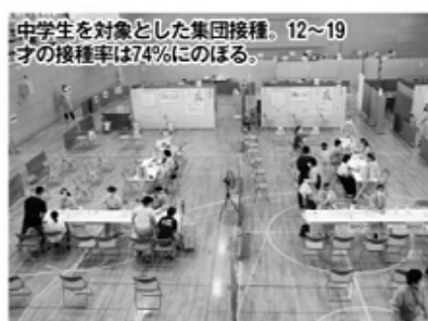
中学生を対象とした集団接種。12～19歳の接種率は74%にのぼる。