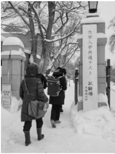
受験生を対象に優先接種を行う自治体も少なくなかった。

優先接種「や」オミクロン株による休校」といったニュースが取りざたされる一方、ワクチン後遺症に苦しむ子供の声はまったく報道されない。しかし彼らのようなケースは決して珍しいものではない。厚労省は現在、約3週間に一度、「予防接種・ワクチン分科会副反応検討部会」を開き、医療機関や製薬会社から報告された副反応の疑いがある事例数を公表している。