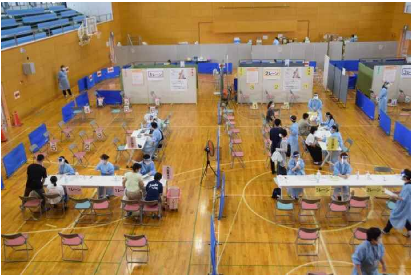
中学生を対象とした集団接種。12～19才の接種率は74%にのぼる

それから、音や痛みにすごく敏感になりました。名前を呼ぶだけでびくつくこともあります。どうして?と聞いたら、『常に頭がぼーっとしているから、急に呼びかけられたように感じる』と言うんです。十分に体を動かすことができないから、ほぐすためにマッサージをしようとして、ポンポンと背中を軽く叩くだけでも、すごく痛がります」