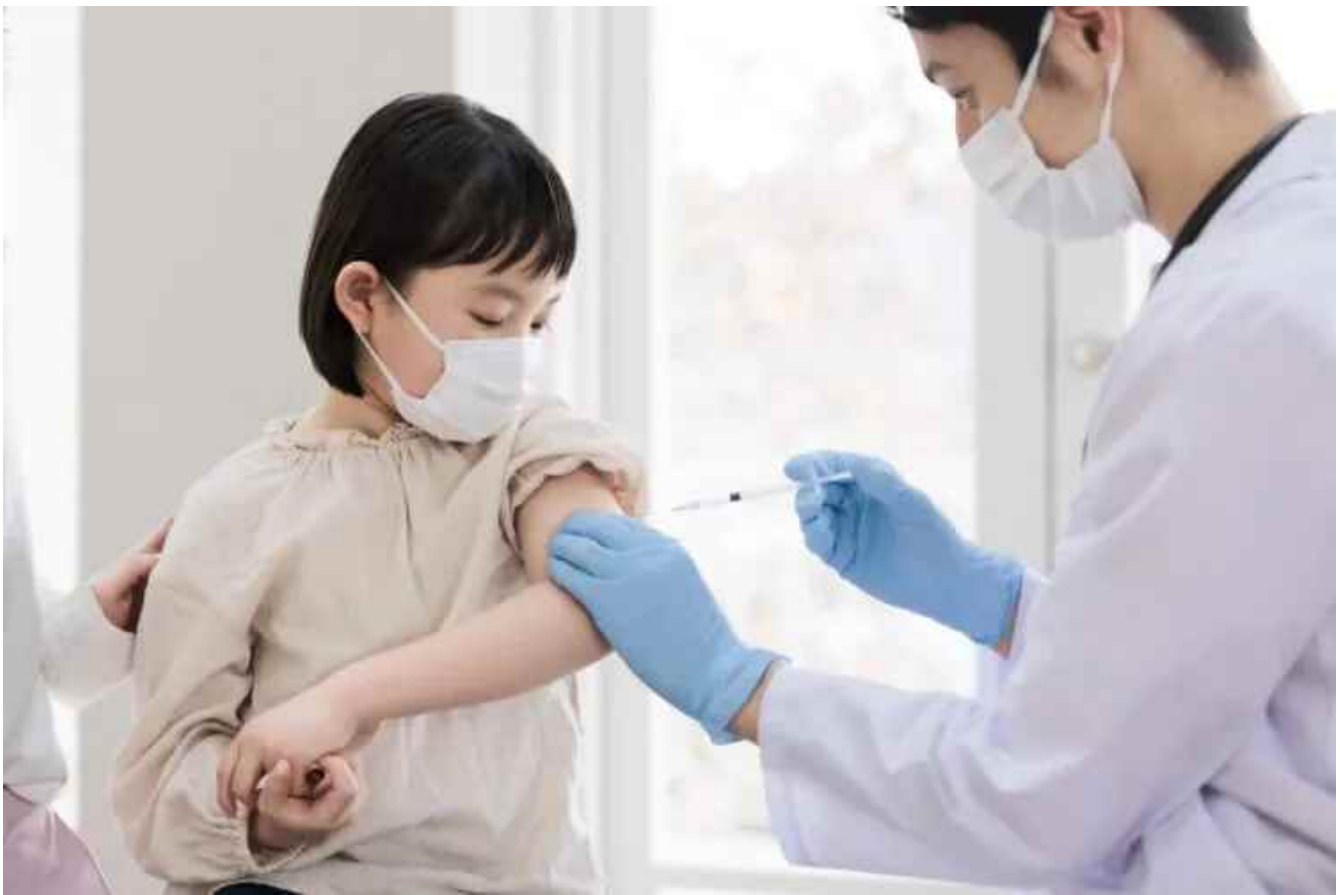
子供のワクチン接種は本当に必要か

仕事のために、家族のために打ったワクチンで体に異変をきたしてしまった——『女性セブン』2022年2月3日号の「コロナより恐ろしいワクチン後遺症」では当事者たちの苦しみを取り上げたが、それは大人だけの問題ではない。接種後に体調を崩して学校に行けず、苦しむ子供たちとその家族がいる。