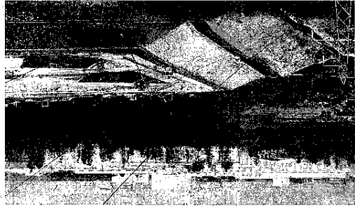
15歳未満の子どもや妊婦の立ち入りを厳禁し、必要に応じて避難を要請するとしている

福島県大熊町、双葉町の帰還困難区域と中間貯蔵施設。15歳未満の子どもや妊婦の立ち入りを厳禁し、必要に応じて避難を要請するとしている。福島県は22日、帰還困難区域と中間貯蔵施設をめぐって、避難指示区域からの立ち入り規制を厳格化する方針を示した。規制は、15歳未満の子どもや妊婦の立ち入りを厳禁し、必要に応じて避難を要請するとしている。