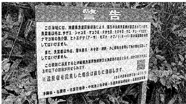
名護漁協が設置した警告板 =20日、名護市瀬瀨

一方で、地元住民は納得していない。「昔はよく海に出ていろいろ採ったけれど、今は捕まるのが