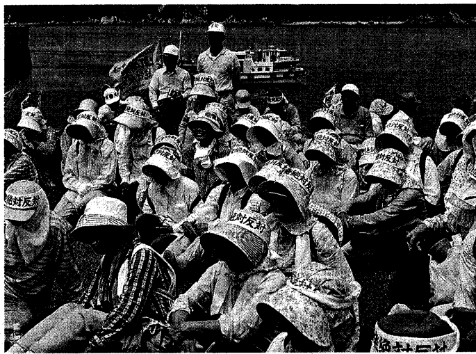
ボリソ調査に抗議する祝島の漁民たち(二〇〇五年六月)

以上のことを踏まれば、現在争点になっている上関原発をめぐる漁業補償には、次のような問題点があります。 ①中電からの約一〇億