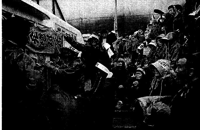
中電の祝島上陸に抗議する農民(二〇一〇年三月)