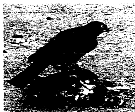
杉並第一小学校校庭でハトを捕えたツミ(東京都指定絶滅危惧種のタカ類)。屋敷林周辺に生息している

実は、この手法は豊洲市場における東京都と東京ガスの権利交換で行われたのと同じだ。豊洲市場では開場直前に土壌汚染が大きな問題となったが、阿佐ヶ谷の計画でも汚染の可能性のある病院用地が公共用地との権利交換の対象となっていることに注目したい。これらは公共用地をつかった「汚染地のロンダリング」と呼ぶのがふさわしいだろう。